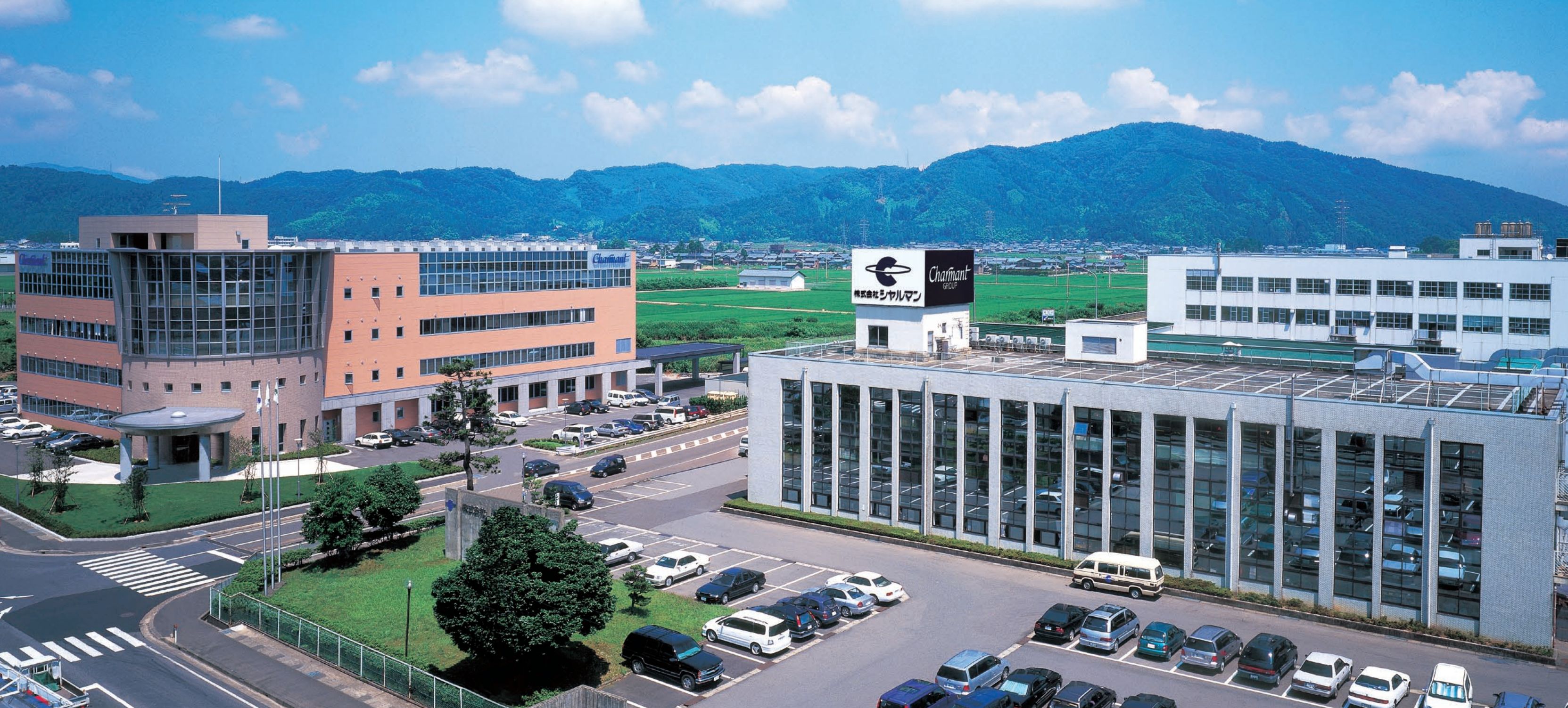
株式会社シャルマン(グループ本社) [左]、(製造部) [右]